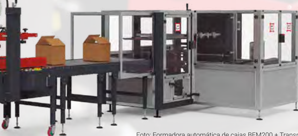
Foto: Formadora automática de cajas BEM200 + Transportadores de rodillos para cajas + Cerradora semiautomática P15 + Transportador extensible de roldanas

Photo: Automatic Case Former BEM200 + Rollers conveyors for boxes + Semiautomatic Case Sealer P15 + Extendable wheels conveyor