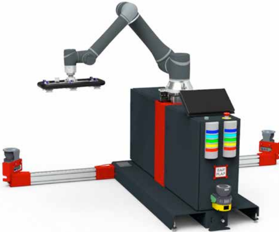
Foto: Estación de paletizado doble con cobot y láseres SICK