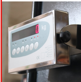
Báscula con display

Chasis reforzado con báscula integrada, con 6 células de peso y display