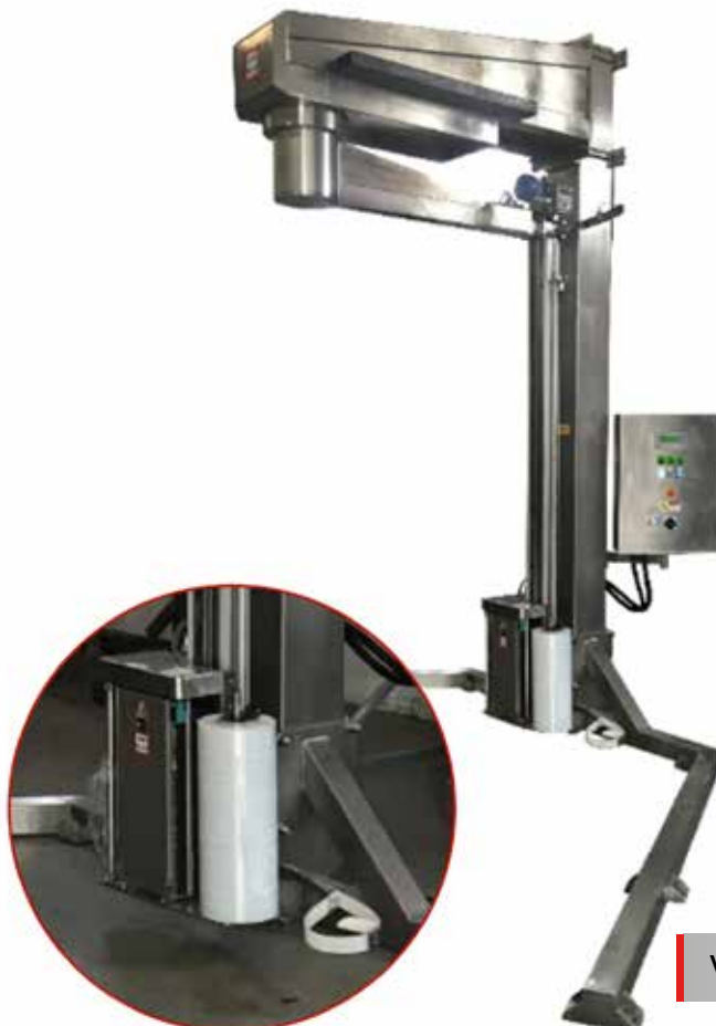
Versión Inox 304