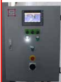
Panel de mando

Con pantalla táctil para configuración de programas